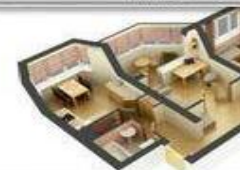
Дача, садовый дом и др. строения потребительского назначения