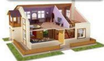
Жилое помещение/жилой дом с земельным участком